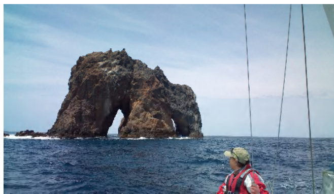
左と同じ岩 二つの穴が開いていて見る方向によって見えたり見えなかつたりする