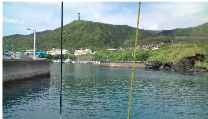
阿古港入り口の狭い水路を取って港内へ