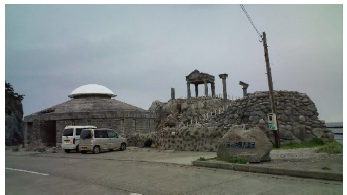
新島・湯の浜露天温泉 無料の温泉 100円ロッカー 100円シャワーあり