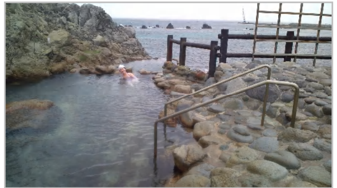
湯の浜露天温泉 大小五つほどの岩風呂がある