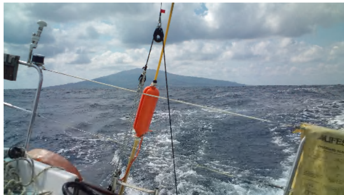
5月26日 三宅島を離れ油壺へ向かう。