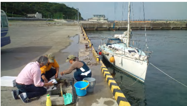
5月25日 嵐も収まった。漁協荷揚場で仕入れに来ていたおばさんから頂いたイカをさばく