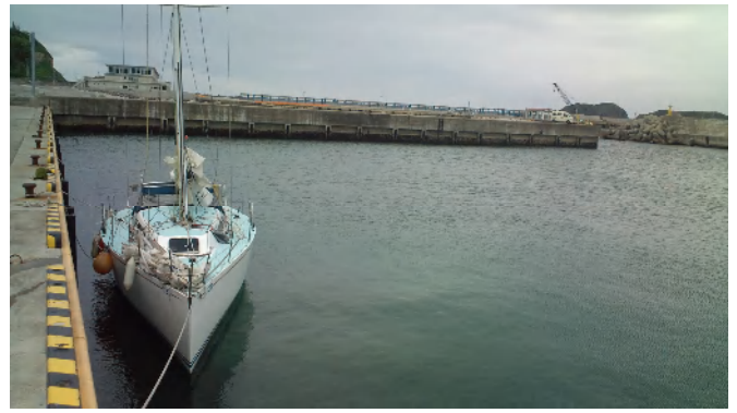
5月23日 15:00 新島港に入港 入港時は静かな泊地だったが、翌日前線通過で夜から未明にかけて大荒れにもやいロープが擦り切れて切断するなど散々だった