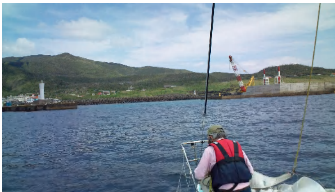
三宅島阿古港に近づく