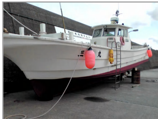
整備中の漁船は船台のかわりにドラム缶と古タイヤで上架

雲が晴れて星空。見納めの三宅島を見ながらデッキで歯を磨いていたら、村の防災無線が何か流している。亜硫酸ガス濃度が高いため、屋内退避せよとのこと。硫黄のような臭気は、亜硫酸ガスだったらしい。風が北東なので、南西の阿古地区は危険区域。活火山と共に生きる島の現実に直面。UF0一同、仕方なくキャビンに籠り、ハッチを閉めて就寝。亜硫酸ガスと酸欠、どちらがより怖いかはよくわからない。