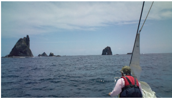
三本岳に近づく 三本岳は三宅島の数マイル西にある岩礁