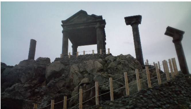
新島・湯の浜露天温泉 パルテノン神殿風のやぐらがある