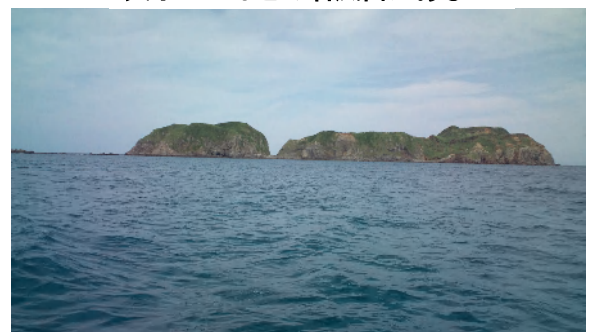
地内島 新島と地内島、式根島の間を抜けて三宅島へ向かう