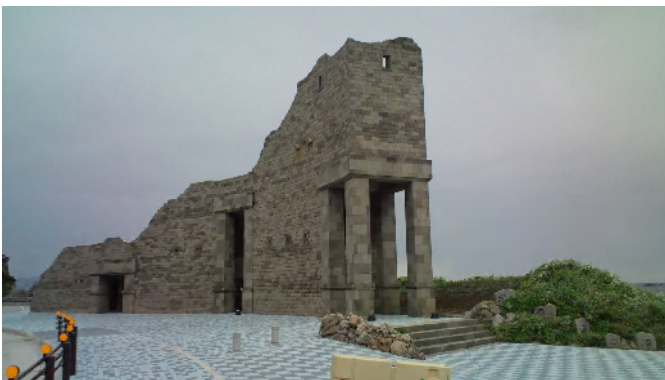
新島港 港の近くにあるモニュメント 「光と風と波の塔」