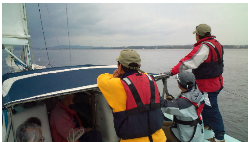
母港に近づく 三浦半島三崎沖 17:30 油壺三崎マリンに帰港