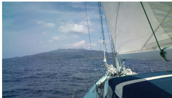
三本岳を後にして三宅島に向かう