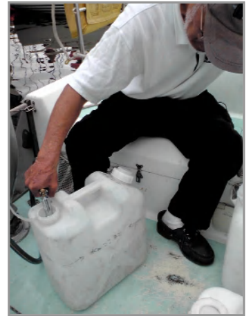
働く川島船長:水汲みた