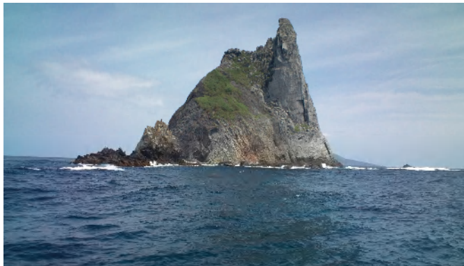
三本岳の北側の一番大きな岩