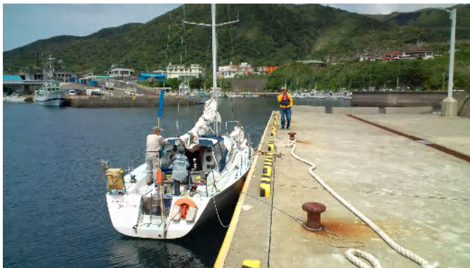
阿古港の岸壁に着艇