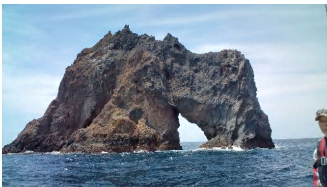
三本岳の南側の二番目の大きさの岩 北側の大きな岩とこの岩の間を通過