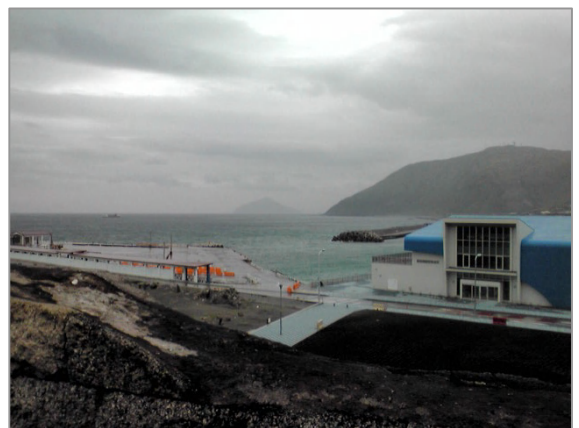
新島港内:青い屋根は東海汽船の待合所