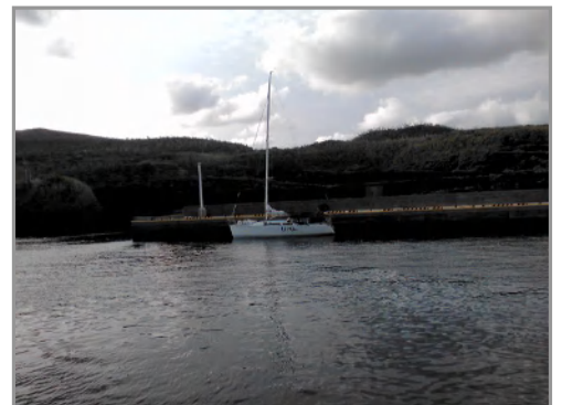
阿古港に入港したUFO

1300 三宅島阿古港入港。港から徒歩3分の「ホテル海楽」で入浴、ホテル斜め向かいの店で生鮮品や飲物など買出しの後、船に戻って宴会。